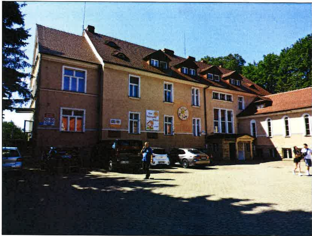
1 ELEWACJA PÓŁ.WSCH.