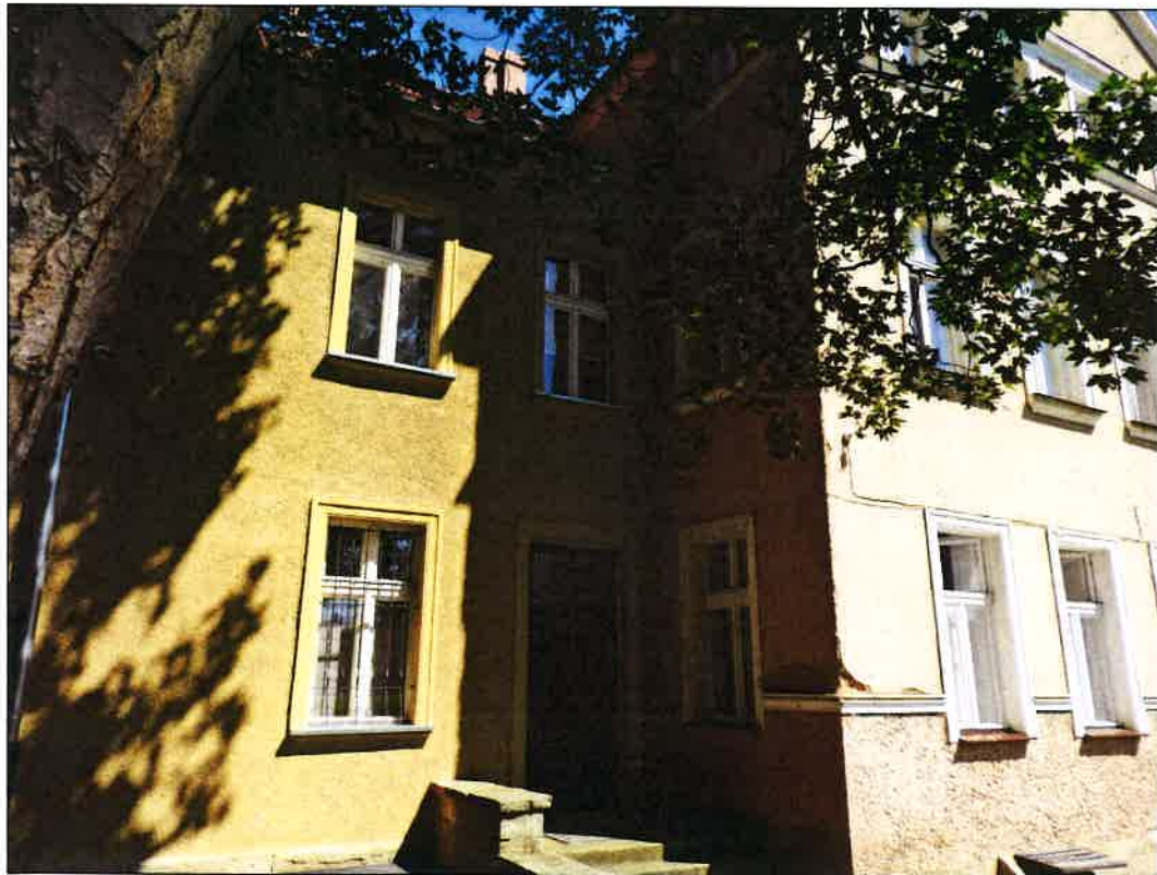
3 ELEWACJA POŁUD.-ZACH.