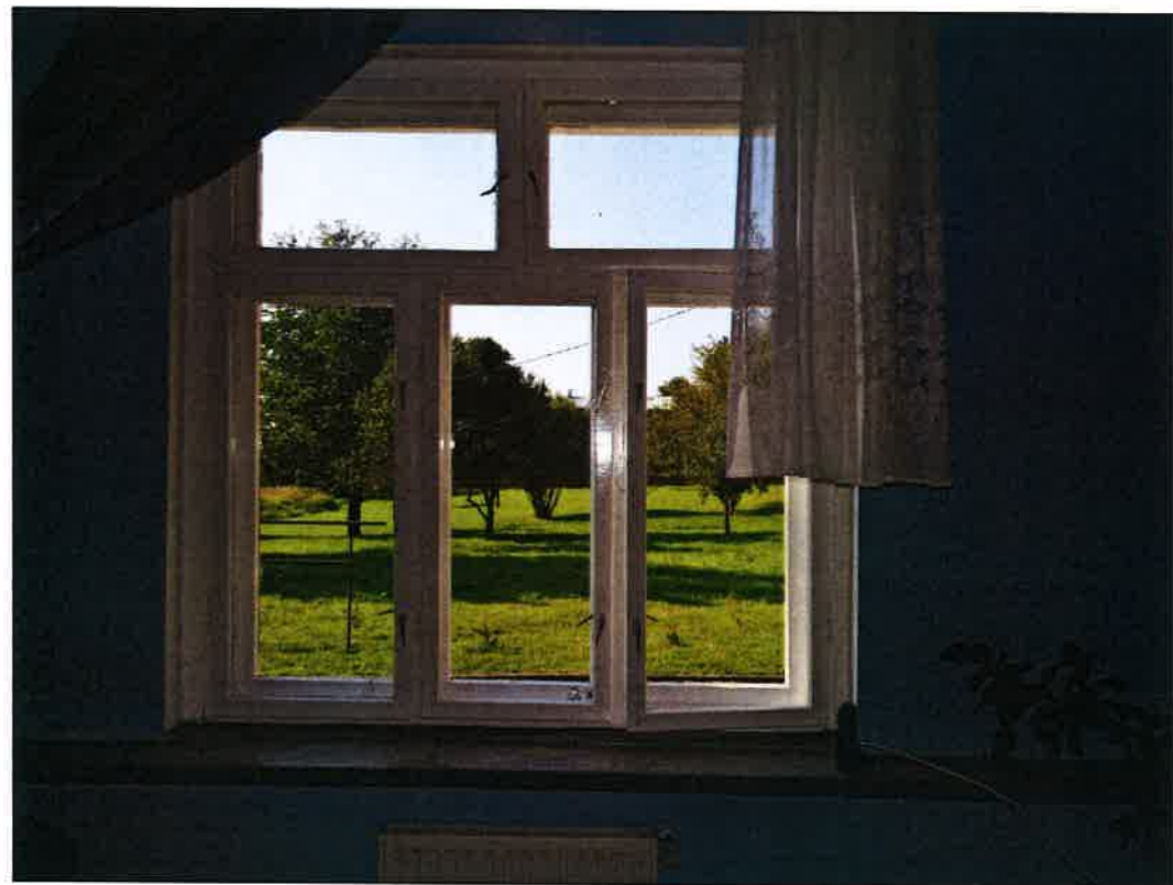
parapet wewn. z lastrico okna 08