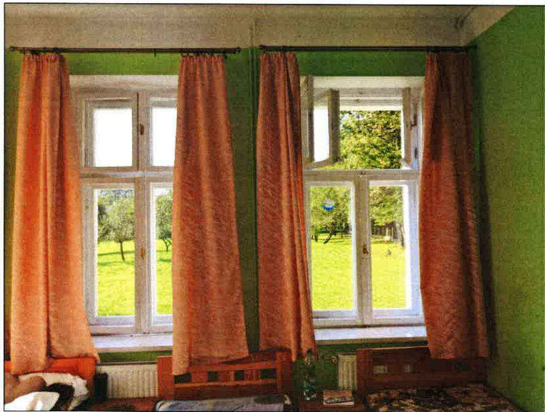
parapet wewn. drewniany okna 07