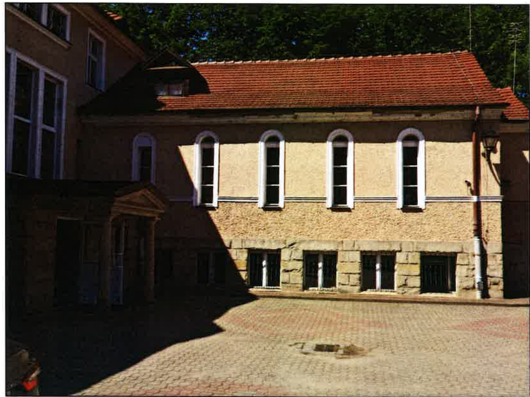
2 ELEWACJA POŁ.- WSCH.