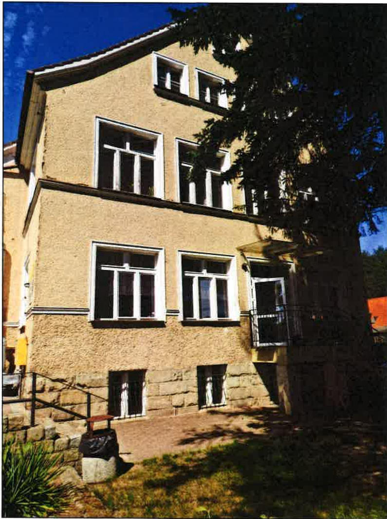
2 ELEWACJA POŁ.- WSCH.