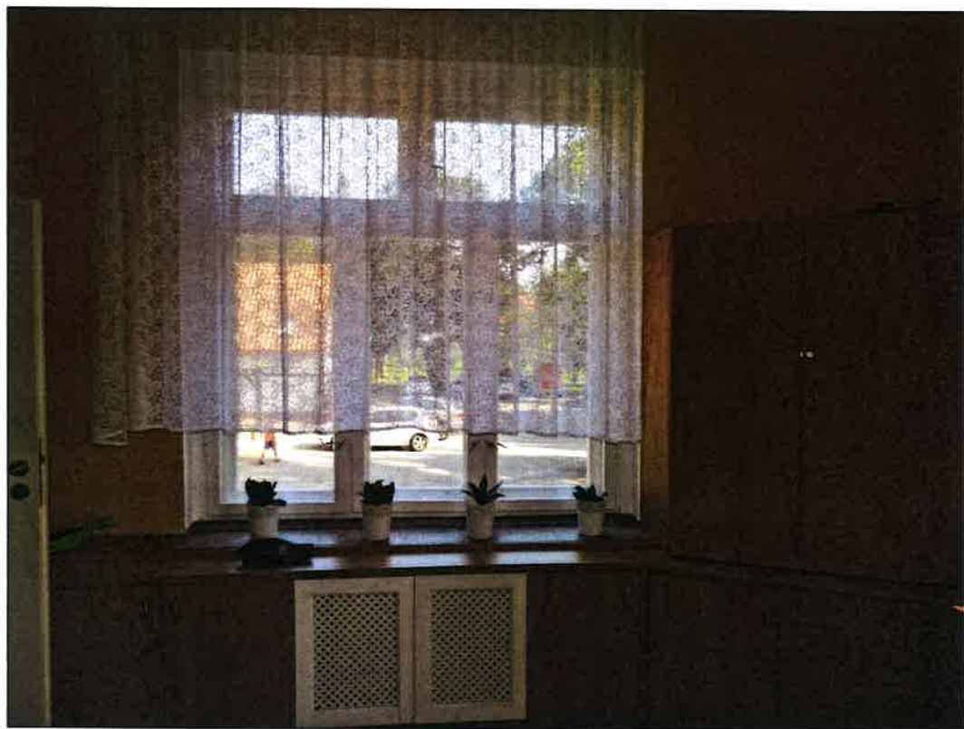
parapet wewn. z lastrico okna 08