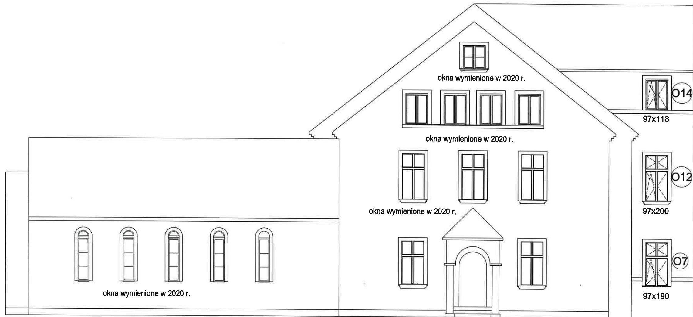
OKNA ELEWACJA od ul.KORCZAKA WYMIENIONE W 2020 r.