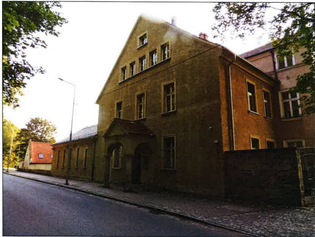
4 ELEWACJA PÓŁ.ZACH. - OKNA OD UL. KORCZAKA WYMIENIONE