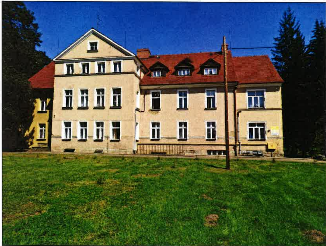
3 ELEWACJA POŁUD.-ZACH.